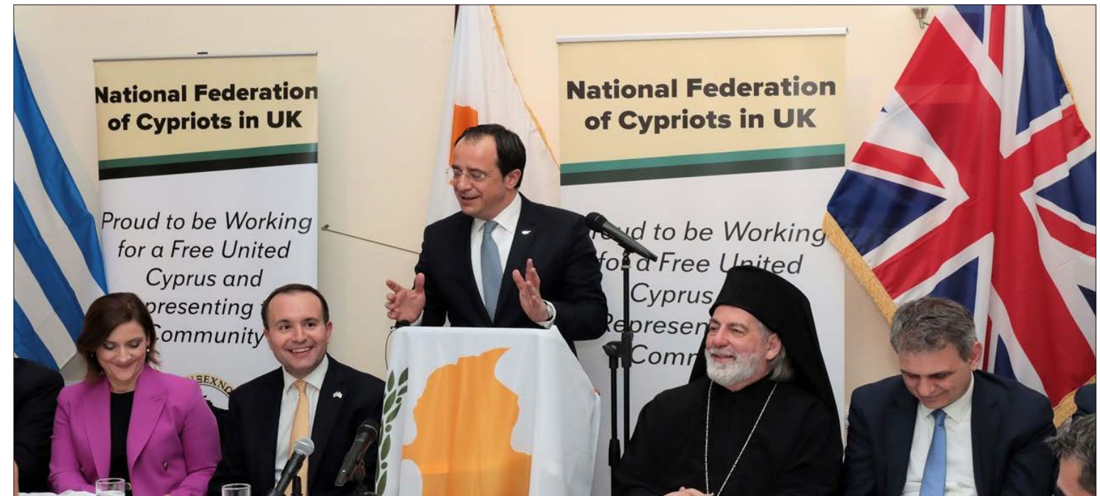
Ο Πρόεδρος Χριστοδουλίδης απευθύνεται προς τους παρευρεθέντες

Κλείνοντας την ομιλία του ο Πρόεδρος Χριστοδουλίδης είπε: «Θα ήθελα να πω ότι σε αυτή την περίοδο της διακυβέρνησής μας, η ομογένεια μας είναι πάρα πολύ ψηλά. Είπα και πριν ότι είχα την ευλογία να δουλέψω μαζί σας, είχα την ευλογία ως φοιτητής να γνωρίσω την παροικία και στις ΗΠΑ, είχα την ευλογία ως διπλωμάτης να γνωρίσω την παροικία μας στην Αθήνα,