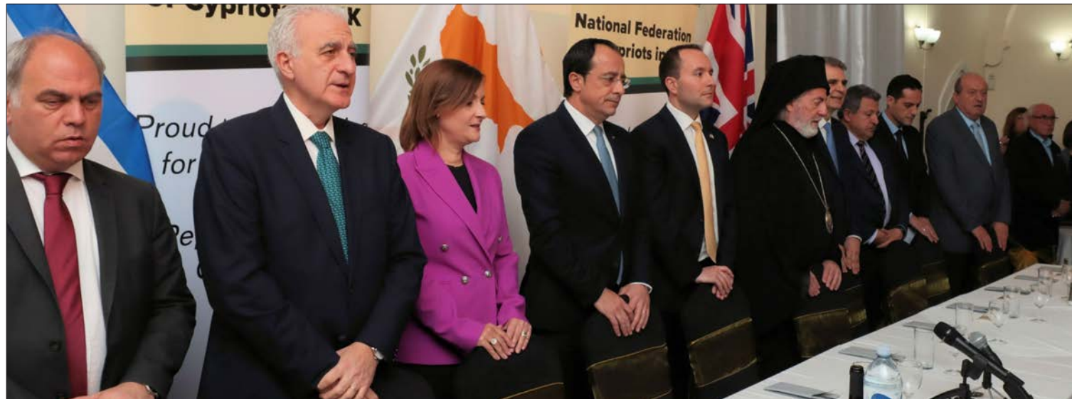
Το τραπέζι με τον Πρόεδρο της Δημοκρατίας και τους προσκεκλημένους

λής. Έχουν την άσβεστη φλόγα της ελπίδας πως η κατεχόμενη πατρίδα μας θα είναι ξανά πάλι ελεύθερη και επανενωμένη.