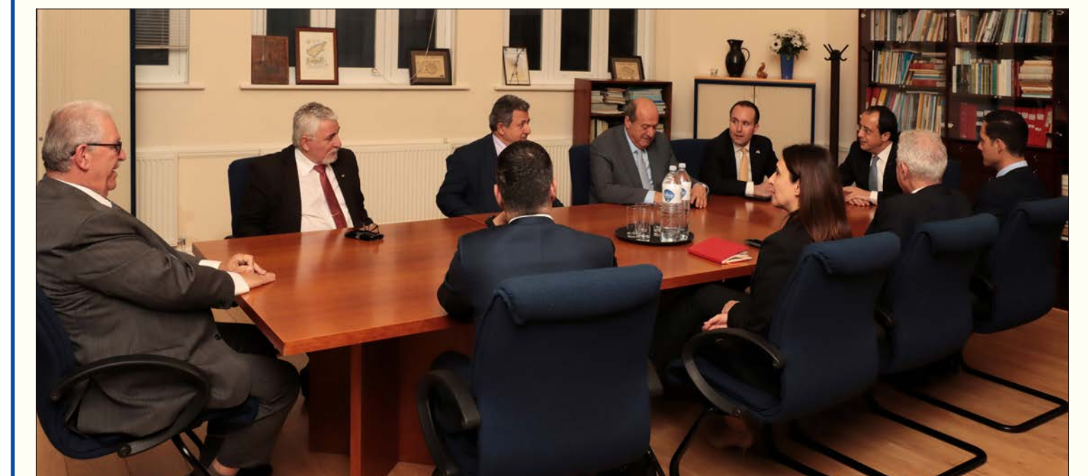
Στιγμιότυπο από τη συνάντηση του Εκτελεστικού Συμβουλίου της Εθνικής Ομοσπονδίας με τον Πρόεδρο Χριστοδουλίδη. Παρόντες ήταν επίσης ο Υπάτος Αρμοστής Ανδρέας Κακουρής, ο Κυβερνητικός Εκπρόσωπος Κωνσταντίνος Λετυμιπίτης, η διευθύντρια του Διπλωματικού Γραφείου του Προέδρου Μαριλένα Ραουνά και ο αν. Υπάτος Αρμοστής Σπύρος Μιλτιάδης.

Της συνάντησης με την ΕΚΟ είχε προηγηθεί συνάντηση του Προέδρου και με την Επιτροπή Συγγενών Κυπρίων Αγνοουμένων ΗΒ.