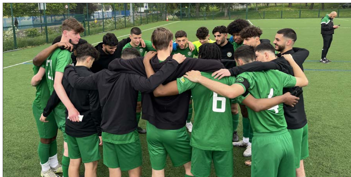
UNDER 18 WHITE