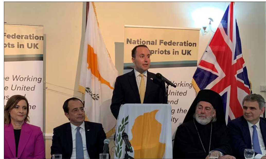
Ο πρόεδρος της ΕΚΟ Χρ. Καραολής καλωσορίζει τον Πρόεδρο Χριστοδουλίδη

Με εμφανή συγκίνηση ο Πρόεδρος της Κυπριακής Δημοκρατίας Νίκος Χριστοδουλίδης παρέστη στη συνεστιάση που παρέθεσε προς τιμή του η Εθνική Κυπριακή Ομοσπονδία Η.Β., όπου είχε την ευκαιρία, για πρώτη φορά υπό τη νέα του ιδιότητα να απευθυνθεί προς την κυπριακή Παροικία της Βρετανίας. Αναπόλησε με αισθήματα αγάπης τα χρόνια που υπηρέτησε ως Γενικός Πρόξενος στη Βρετανία κάνοντας τα πρώτα διπλωματικά του βήματα. Θυμήθηκε πρόσωπα με τα οποία συνεργάστηκε στενά, λέγοντας ότι οι συμπατριώτες μας έχουν σαν κόμμα τους την Κύπρο. Αναφέρθηκε στο Κυπριακό τονίζοντας ότι η λύση πρέπει να έχει ευρωπαϊκό περιεχόμενο και προσανατολισμό και να καθιστά την Κύπρο ένα φυσιολογικό, λειτουργικό κράτος, χωρίς στρατό κατοχής και εγγυήσεις και με αμοιβαίο σεβασμό και εφαρμογή των Ανθρωπίνων Δικαιωμάτων.