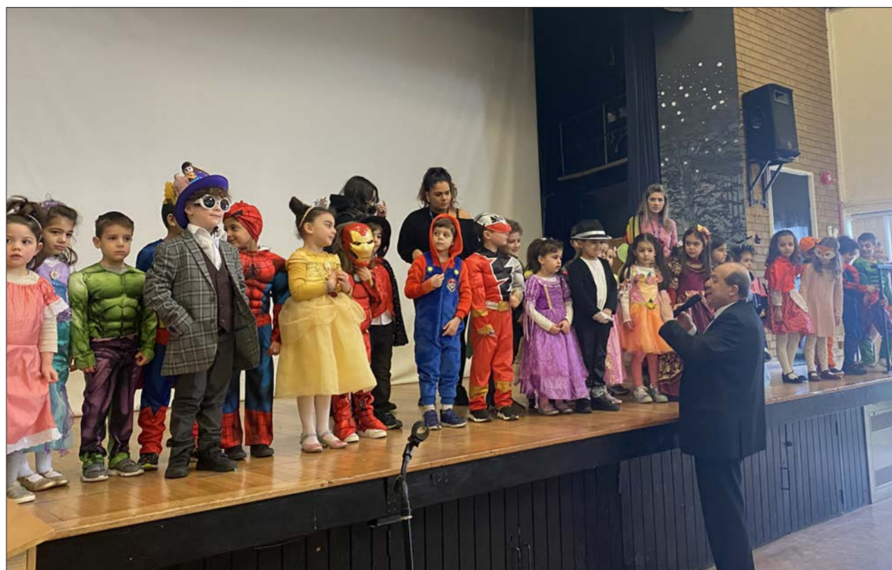
Παιδιά του Νηπιαγωγείου και της Προδημοτικής στο Μάνορ Χιλλ ανέβηκαν στη σκηνή μεταμφιεσμένα

Κατά τη διάρκεια του διαλείμματος οι Επιτροπές Γονέων διοργάνωσαν διάφορα για τα παιδιά και ετοίμασαν εδέσματα για όλους.