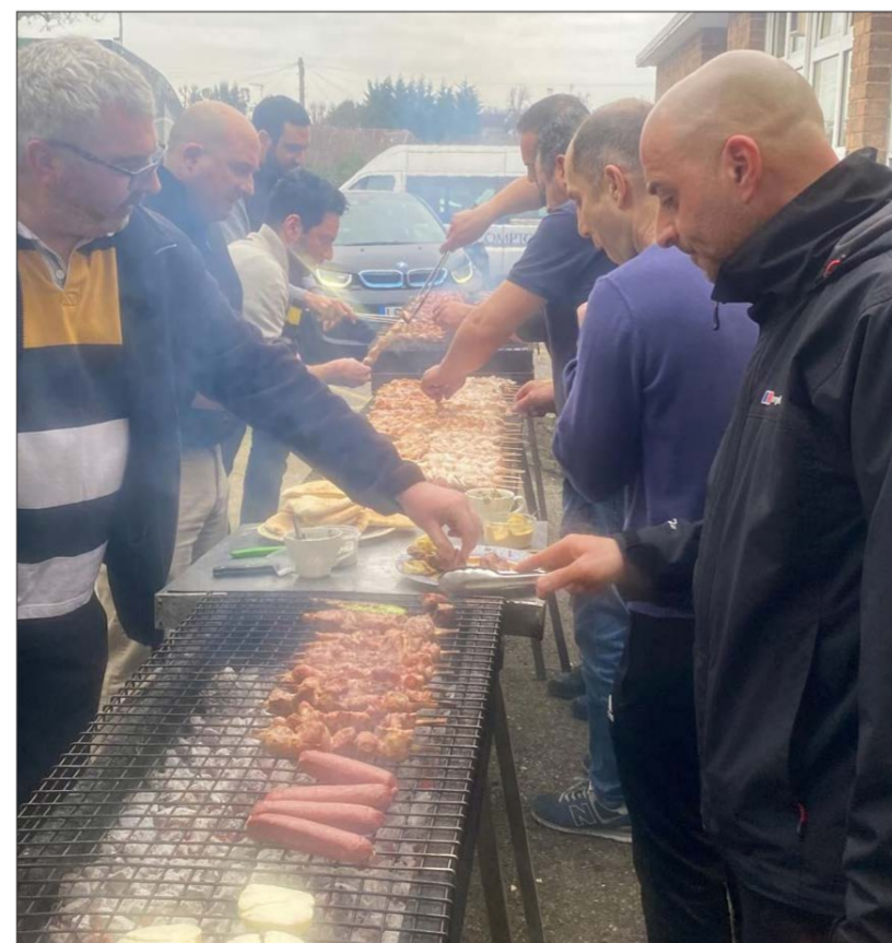
Οι Επιτροπές των σχολείων ετοίμασαν σουβλάκια και άλλα «συνοδειτικά» για να γιορτάσουν την Αποκριά.