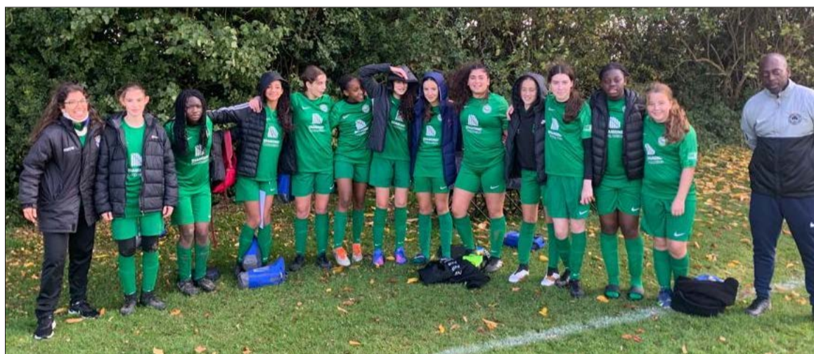
UNDER 15 GIRLS