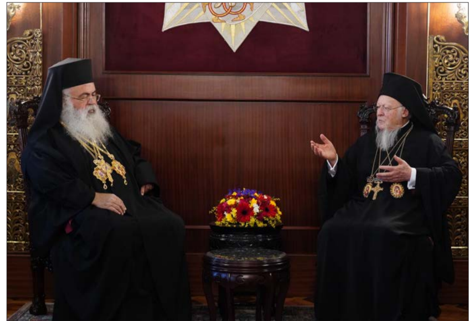
ΣΥΛΛΕΙΤΟΥΡΓΟ ΤΗΝ ΚΥΡΙΑΚΗ ΤΗΣ ΟΡΘΟΔΟΞΙΑΣ

«Οσάκις η αγάπη του Θεού μας αξιώνει να επισκεπτόμαστε τη Βασιλίδα των Πόλεων και να περνούμε την ιεράν Πύλην του Οικουμενικού Πατριαρχείου, του πνευματικού κέντρου της Ορθοδοξίας, νιώθουμε τη θρησκευτική και εθνική συγκίνηση να πλημμυρίζουν την καρδιά