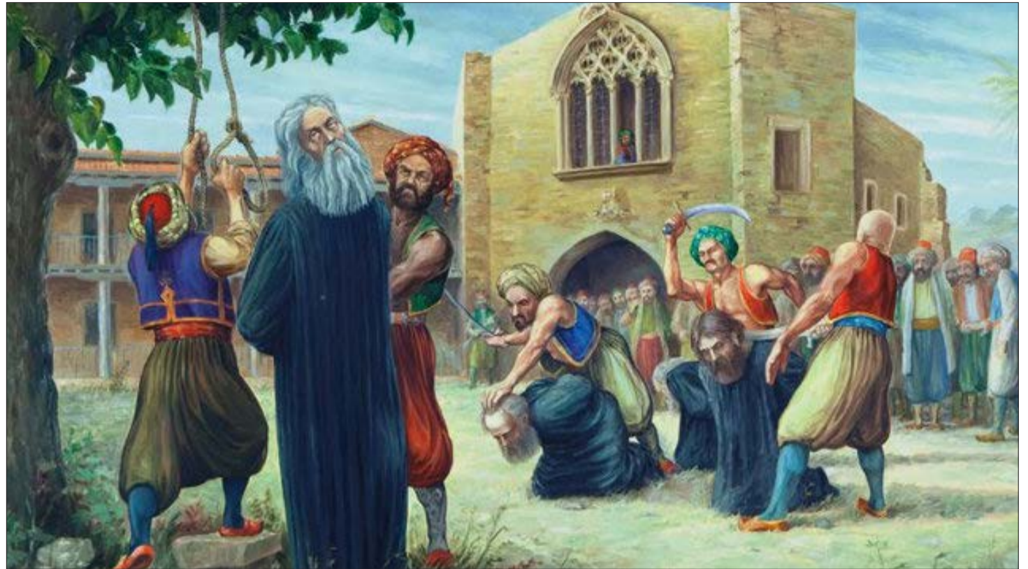
Ο πίνακας του Γ. Μαυρογένη, που με εξαιρετική παραστατικότητα αναπαριστά τον απαγχονισμό του Εθνομάρτυρα Αρχιεπισκόπου Κυπριανού και τον αποκεφαλισμό άλλων ιερωμένων.