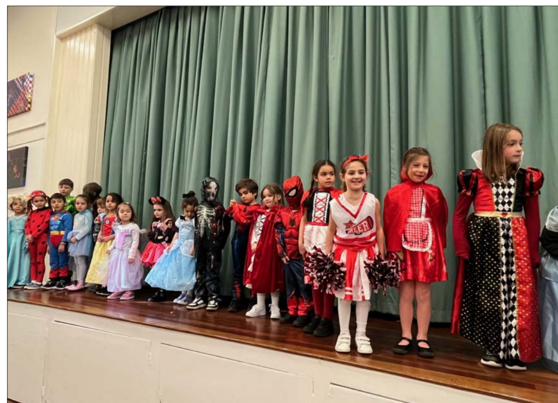
Έξοχνα μασκαρέματα στο Φίνσλεϋ