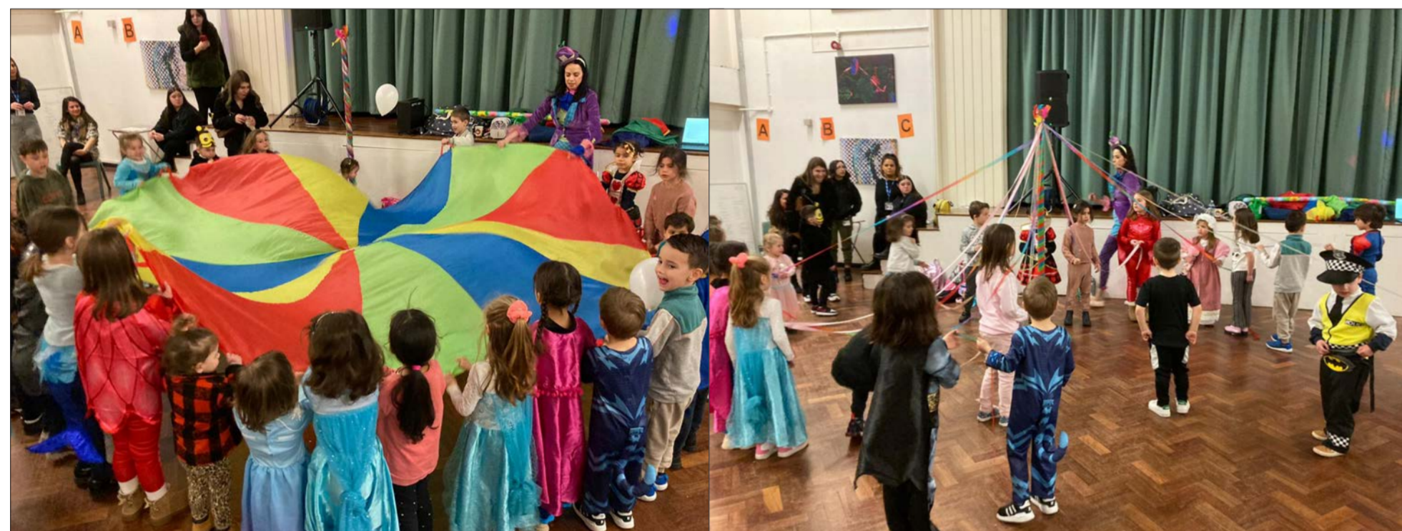
Παιχνίδια της Αποκριάς στο Φίνσλεϋ