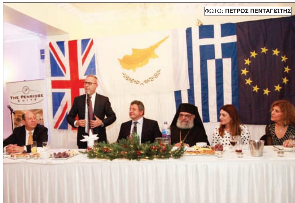
Ο πρόεδρος του Δημοκρατικού Συναγερμού απευθύνει χαιρετισμό στη χοροεσπερίδα

Ο κ. Νεοφύτου σημείωσε ότι θα ζητήσει την υποστήριξή τους για την Κύπρο, διότι η Βρετανία έχει