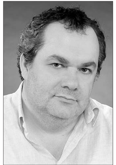
Γράφει από την Αθήνα ο συνεργάτης μας Γιώργος Λεκάκης, συγγραφέας, λαογράφος www.lekakis.com

—Πηγής ή Μεταλλείου (265 στρ.) τεχνητή λίμνη του Μεγάλου Ρέματος (τ. Κοτζά-ντερέ), παραποτάμου του Αξιού.