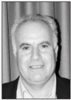
ΤΟΥ ΔΗΜΗΤΡΗ ΕΥΣΤΑΘΙΟΥ