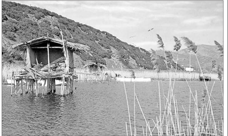
Λίμνη Δοϊράνη (άποψη)

—Βεγορίτις ή Άρνισσας ή Κέλλη (54 τ.χλμ. – αν και κάποτε ήταν 68 τ.χλμ.) λίμνη στα σύνορα ν. Πέλλης-Φλωρίνης. Κάποτε είχε βάθος 65 μ. και ήταν η βαθύτερη λίμνη της χώρας! Σήμερα έχει βάθος 50 μ. 13 Με τον ορογέννηση Βερμίου-Βέρνου