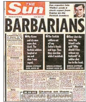
Δικαστηρίου Ανθρωπίνων Δικαιωμάτων:

Άλλη αναφορά ήταν στη δίκη Λοϊζίδου εναντίον Τουρκίας 1996 στην απόφαση του Ευρωπαϊκού