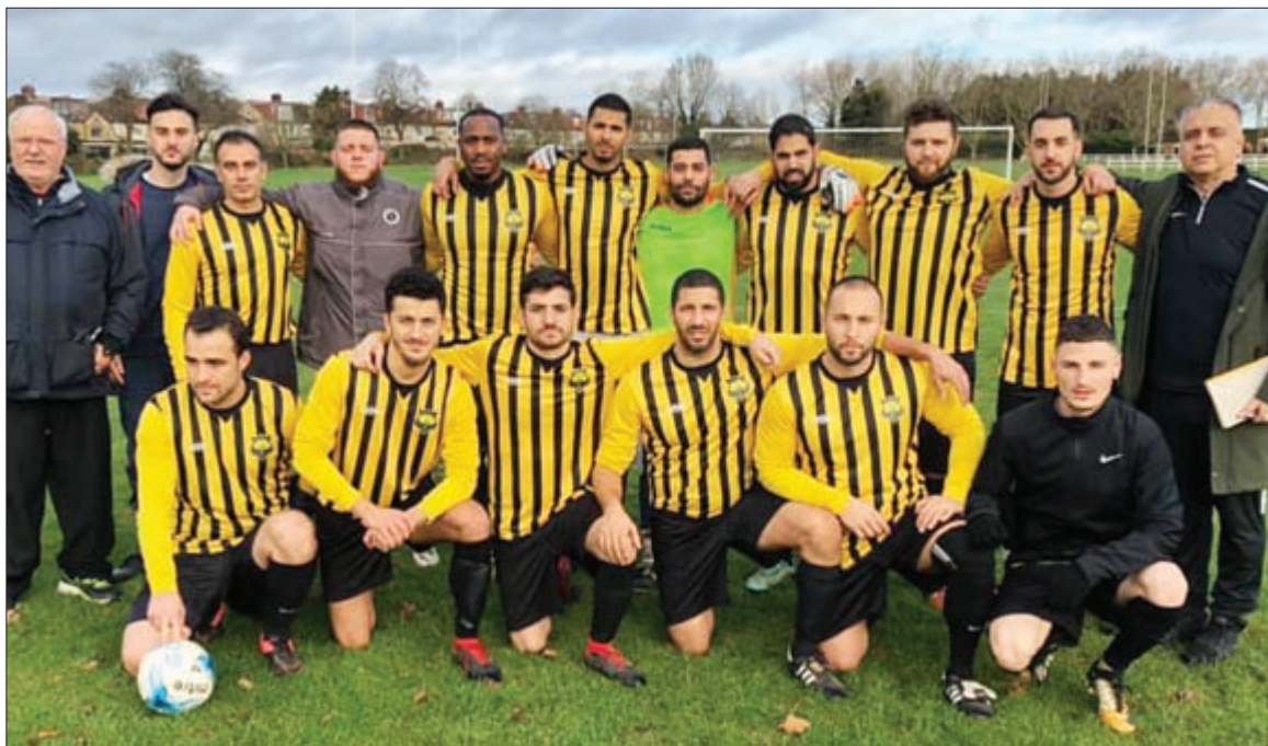
CINAR BOUNCE BACK IN CUP

St Panteleimon once again had their game called off this time due to the bad condition of their opponents pitch. I pity the Saints' next opponents as they will be facing very fresh squad of players after a