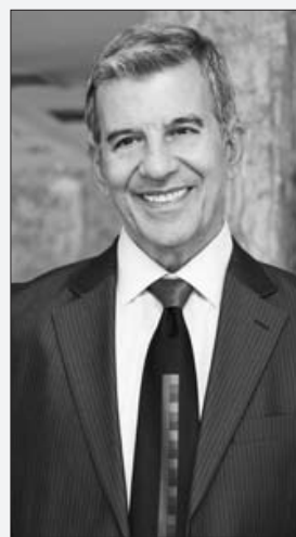
Ο Έλληνας τραγουδιστής Γιώργος Γερολυμάτος