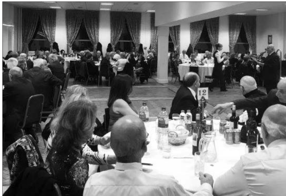
Αποψη της αίθουσας όπου έγινε η χοροεσπερίδα

Σύνδεσμο και κατ' επέκταση την ίδια την κατεχόμενη Αχνα. Και μεταξύ άλλων είπε: