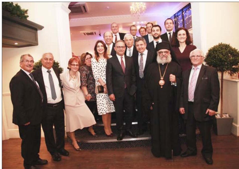
Ο Αβ. Νεοφύτου με στελέχη του ΔΗΣΥ και άλλους προσκεκλημένους στη χοροεσπερίδα

Δήλωσε ότι η ίδια ήταν και θα παραμείνει υπο-