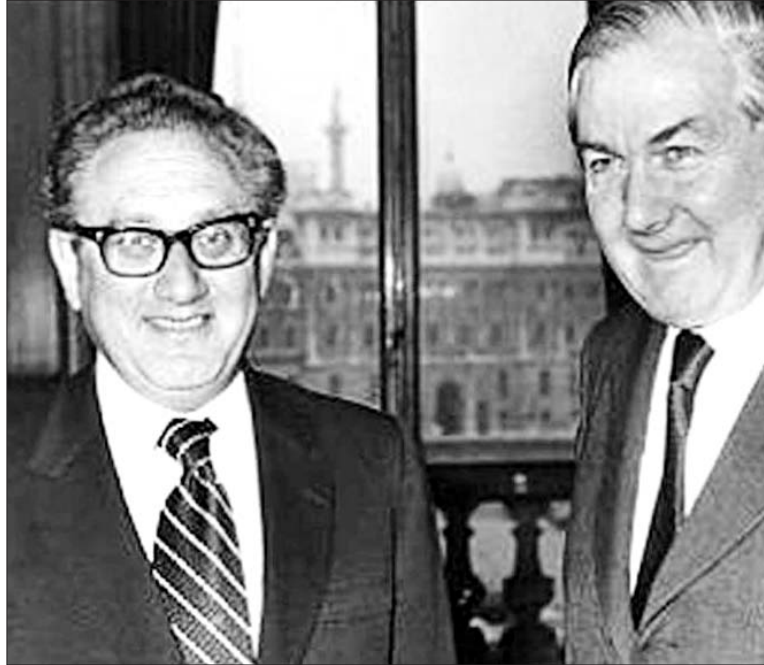
Κίσινγκερ και Κάλλαχαν, εκ των πρωταγωνιστών στη διαμόρφωση του Κυπριακού

Λοιπόν, στις 10 Σεπτεμβρίου 2015 με άρθρο μου στη «Σημερινή», με τίτλο «Οι πραγματικές προθέσεις του Λονδίνου», δημοσίευσα τι μας αποκάλυψαν οι ίδιοι οι Βρετανοί, με έγγραφα που εντόπισα σε διαφορετικό φάκελο στον οποίο αποκαλύφθηκε και επιβεβαιώθηκε ότι: Το 1974 επεδίωκαν και εκείνοι κατάλυση της Κυπριακής Δημοκρατίας και νέα συνταγματική τάξη γεωγραφικού διαμελισμού συμφωνώντας με την Τουρκία. Αυτό το κίνη-